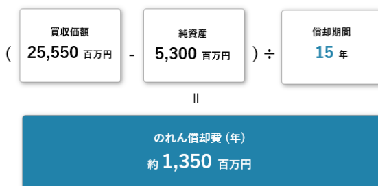
のれん償却費の計算方法

※純資産は暫定数値 取得価額の配分(Purchase Price Allocation)及び償却期間は、監査法人と協議後確定する