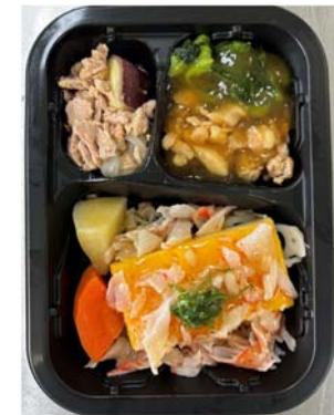
介護施設向け冷凍弁当