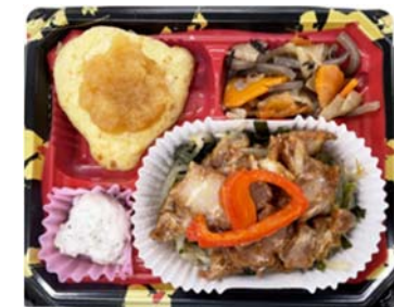
生協様向け夕食宅配弁当