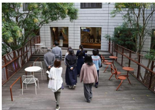
東京品川オフィス「THE CAMPUS」